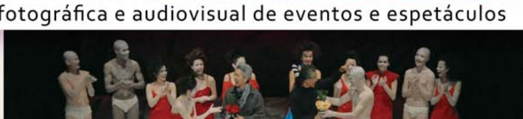
cobertura fotográfica e audiovisual de eventos e espetáculos