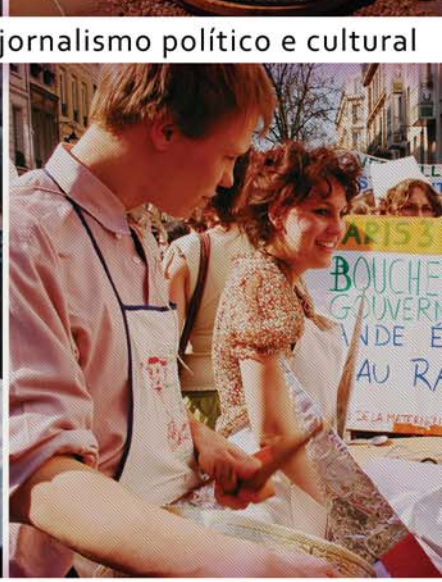
fotojornalismo político e cultural